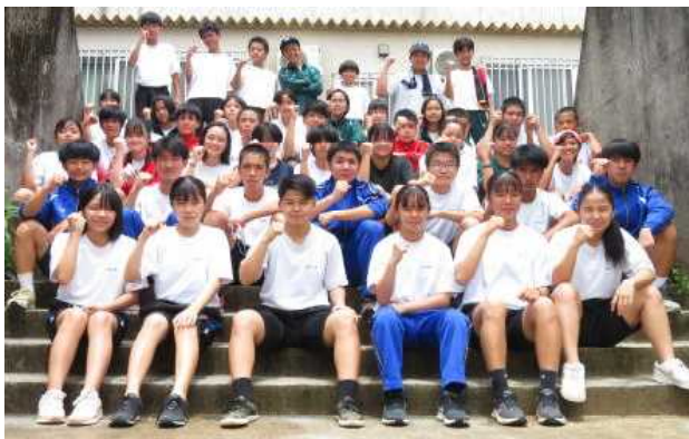
《新たな行事を成功に導いた体育委員の皆さん》

新型コロナの為に参加できなかった生徒や、台風による雨の影響で延期になった種目もあったので、日を改めて実施を予定しています。次もみんなで楽しい行事を創ってください。また雨の中、たくさんの保護者の皆さんにも応援に来て頂きました。ありがとうございました。