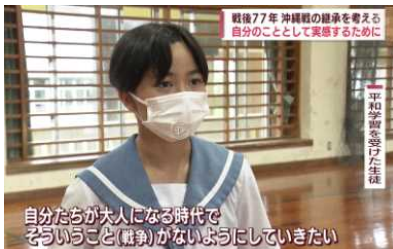
《QAB ニュースのインタビュー》