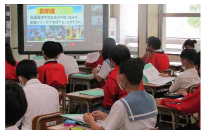
《真剣に生徒総会に臨む2年生》

一人一人の存在を大切にしようと「いじめゼロ宣言」も行われました。みんなで考えて学級や学年に掲示した「いじめゼロ」を意識して、思いやりの溢れる南風原中にしていきましょう。