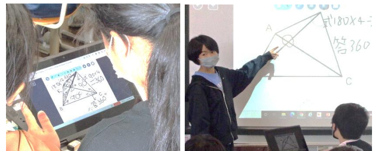
図2 ロイロノートを使って考え合う。